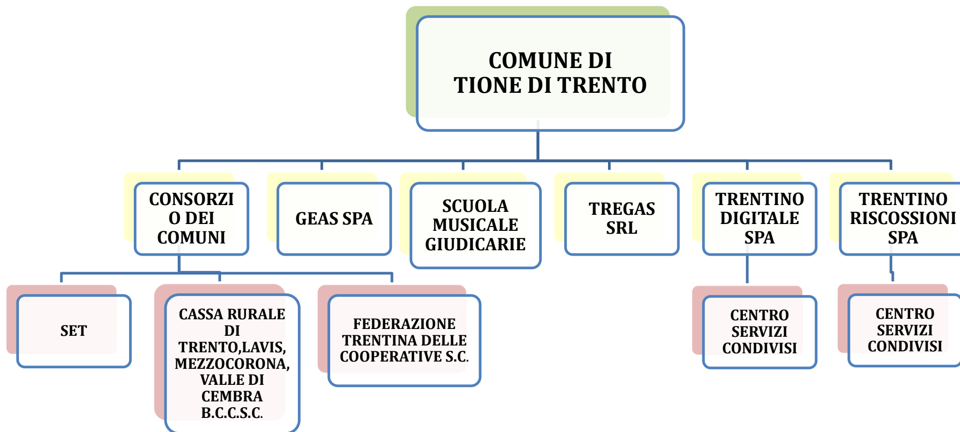
TABELLA 3: SCHEMA ILLUSTRATIVO