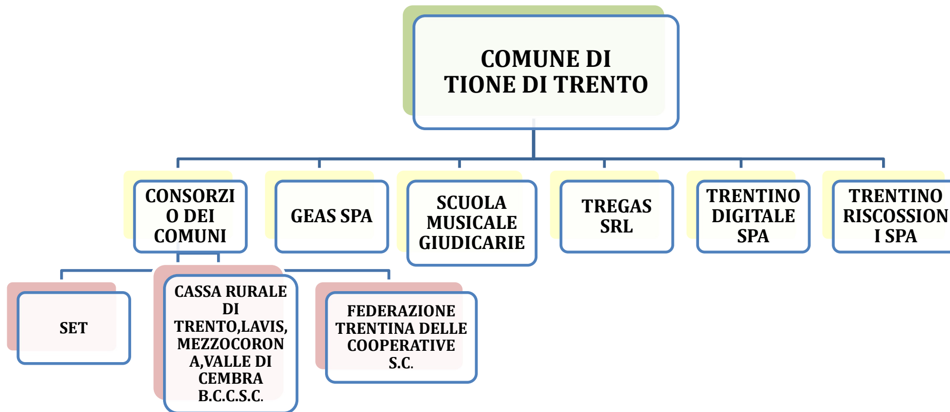
TABELLA 3: SCHEMA ILLUSTRATIVO PARTECIPATE AL 31/12/2024

Nel corso del 2025 è stata costituita la società cooperativa “CER del Sarca società cooperativa”, di cui il Comune di Tione di Trento è tra i soci fondatori.